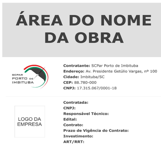
Figura 1 – Modelo de placa de identificação da obra