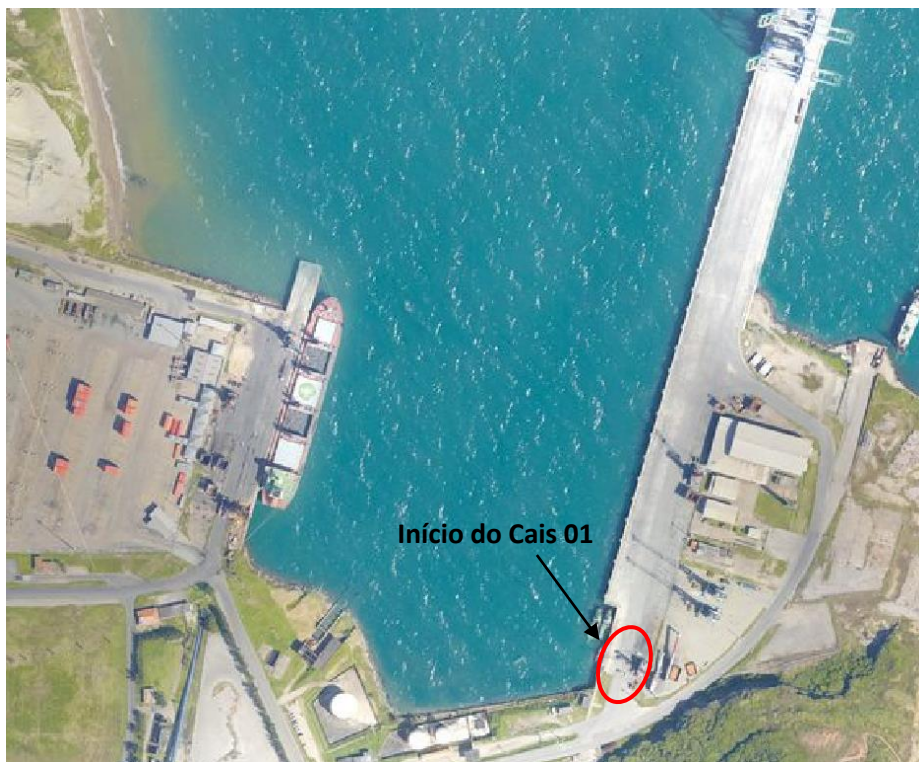
Figura 05 – Localização do serviço a ser realizado